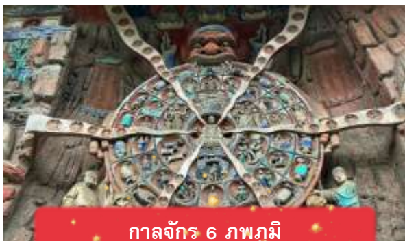
กาลจักร 6 ภพภูมิ

ไฮไลท์ที่ไม่ควรพลาด พระไสยาสน์ปางปรินิพพาน รูปสลักพระพุทธเจ้าในปางไสยาสน์ยาวกว่า 30 เมตร แสดงเหตุการณ์เสด็จดับขันธปรินิพพาน พระพักตร์สงบงดงาม สื่อถึงการเข้าถึงนิพพานอย่างสงบเย็น พระโพธิสัตว์กวนอิม ปางสหัสเนตรสหัสหัตถ์ งานแกะสลักยิ่งใหญ่ แสดงพระโพธิสัตว์กวนอิมที่มี 1,007 พระกร แต่ละพระกรมีพระเนตรบนฝ่ามือ แทนการมองเห็นทุกข์และช่วยเหลือสรรพสัตว์ทุกทิศทาง กาลจักร 6 ภพภูมิ ภาพสลักที่ถ่ายทอดวงจรสังสารวัฏ ทั้ง 6 ภพภูมิ ได้แก่ เทวดา มนุษย์ อสูร สัตว์เปรต และนรก สะท้อนกฎแห่งกรรมและการเวียนว่ายตายเกิด พระไวโรจนพุทธ รูปสลักพระไวโรจนะแสดงพระพักตร์สงบนิ่ง เปล่งรัศมีสว่างไสว เป็นสัญลักษณ์แห่งปัญญาสูงสุดและการตรัสรู้ที่ครอบคลุมสรรพสิ่ง เที่ยง บริการอาหารกลางวัน ณ ภัตตาคาร