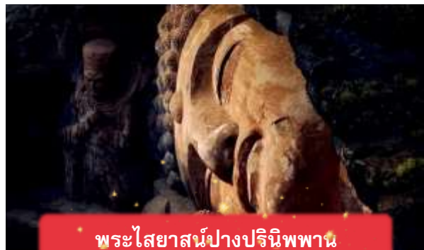
พระไสยาสน์ปางปรินิพพาน