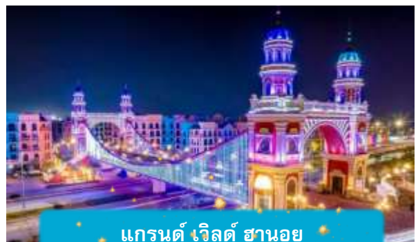
แกรนด์ เวิลด์ ฮานอย