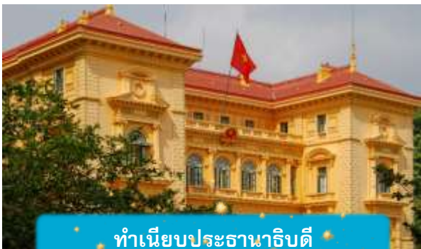
ทำเนียบประธานาธิบดี

เช้า บริการอาหารเช้า ณ ห้องอาหารของโรงแรม นำท่านถ่ายรูปด้านนอก สุสานโฮจิมินห์ จุดเริ่มต้นของการเข้าใจเวียดนาม สถานที่อันเงียบสงบที่สะท้อนจิตวิญญาณของผู้นำผู้ยิ่งใหญ่ สุสานแห่งนี้ไม่ได้เป็นเพียงอนุสรณ์ แต่คือบทเรียนประวัติศาสตร์ที่สัมผัสได้จริง นำท่านเดินทางสู่จุดศูนย์กลางแห่งประวัติศาสตร์เวียดนาม นำชมด้านนอก ทำเนียบประธานาธิบดี อาคารสีเหลืองอร่ามในสไตล์ฝรั่งเศส ที่ยังคงใช้ในพิธีการสำคัญของชาติและชม บ้านพักลุงโฮ บ้านไม้เรียบง่ายริมสระบัว ที่เผยให้เห็นชีวิตสมณะของผู้นำผู้ยิ่งใหญ่ "โฮจิมินห์" สองสถานที่ที่ ส่องเรื่องราวที่สะท้อนความเป็นเวียดนามอย่างลึกซึ้ง ไม่ใช่แค่ท่องเที่ยว แต่คือการเข้าใจจิตวิญญาณของประเทศนี้อย่างแท้จริง เที่ยง บริการอาหารกลางวัน ณ ภัตตาคาร