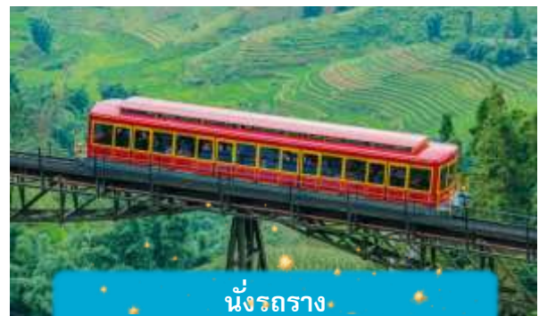
นั่งรถราง

เที่ยง บริการอาหารกลางวัน ณ ภัตตาคาร พิเศษ ... เมนูบุฟเฟ่ฟานซีปัน