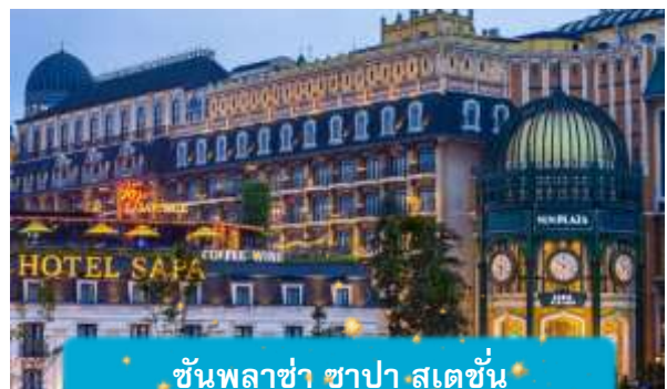
ชั้นพลาซ่า ซาปา สเตชั่น