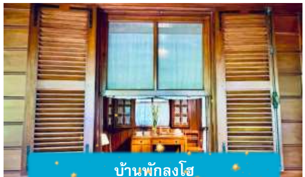
บ้านพักลุงโฮ