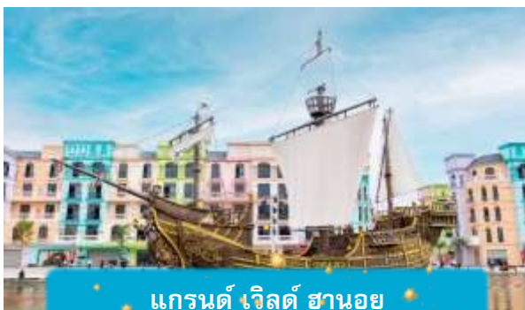
แกรนด์ เวิลด์ ฮานอย