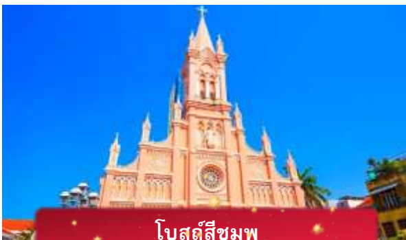
โบสถ์สีชมพู

ค่า บริการอาหารค่ำ ณ ภัตตาคาร พิเศษ ... เมนูบุฟเฟ่ต์ปิ้งย่าง ที่พัก MAGNOLIA HOTEL เทียบเท่าหรือระดับ 4 ดาวท้องถิ่น