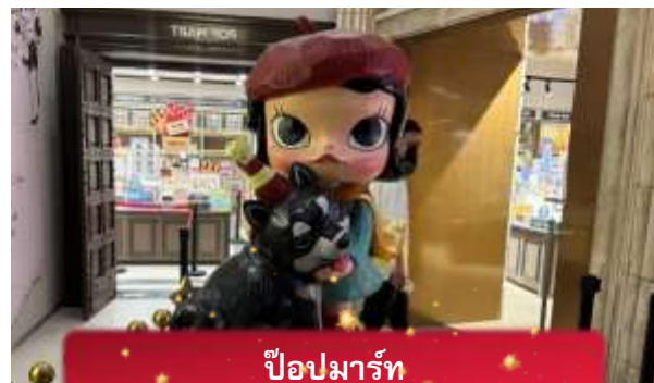
ป๊อปมาร์ท