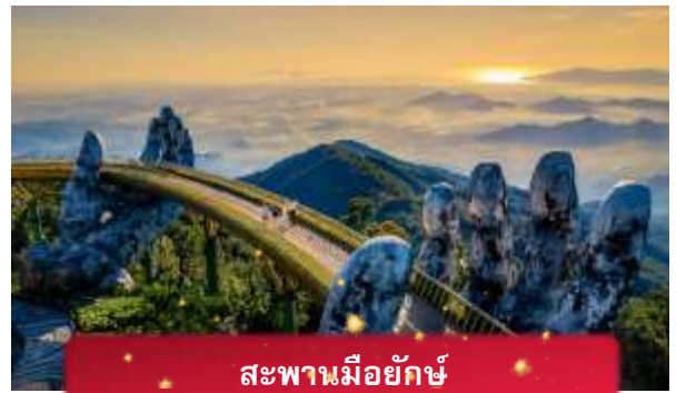
สะพานมียักษ์

นำท่านชม สะพานมียักษ์ แหล่งท่องเที่ยวใหม่ล่าสุดซึ่งอยู่บนเขาบานาฮิลล์ เป็นสะพานสีทองทอดยาวโดยมีมือ 2 ข้างอุ้มไว้ ตั้งอยู่ในตำแหน่งที่โดดเด่นเห็นชัด สวยงาม นำท่านชม สวนดอกไม้แห่งความรัก เป็นสวนดอกไม้สไตล์ฝรั่งเศส ที่มีดอกไม้หลากหลายพันธุ์ถูกจัดเป็นสัดส่วนอย่างสวยงามท่ามกลางอากาศที่แสนเย็นสบาย นำท่านชม สักการะพระพุทธรูปหินอึ้ง เป็นพระพุทธรูปหินองค์ใหญ่ตั้งตระหง่านบนยอดเขาแห่งนี้ ให้ท่านได้ขอพรเพื่อความเป็นมงคล นำท่านชม ป๊อปมาร์ท เป็นร้านค้าของเล่นเปิดใหม่ล่าสุดที่อยู่บนยอดเขาบานาฮิลล์ มีสินค้าของเล่นสำหรับนักจุ่มมากมายให้ท่านได้เลือกชมกับตัวละครน่ารัก อาทิเช่น Molly, SkullPanda, Labubu หมายเหตุ: การจัดการ และข้อกำหนดในการเข้าชมสินค้าอยู่นอกเหนือการจัดการของบริษัททัวร์