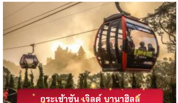
กระเช้าขึ้น เวิลด์ บานาฮิลล์

เที่ยง อีสรอาหารกลางวันเพื่อความสะดวกในการท่องเที่ยว