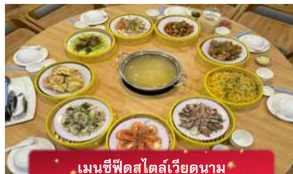
เมนูซีฟู้ดสไตล์เวียดนาม

17.05 เดินทางถึง สนามบินสุวรรณภูมิ โดยสวัสดิภาพ ... พร้อมความประทับใจ