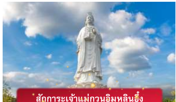
สักการะเจ้าแม่กวนอิมหลินอึ้ง