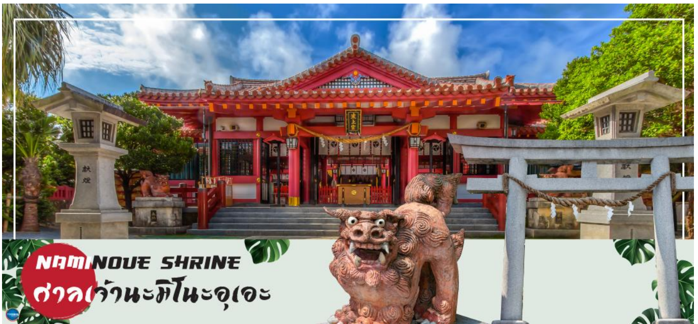
NAMINOUE SHRINE ศาลเจ้านะมิโนะอุเอะ

วันที่สี่ ศาลเจ้านามิโนะอุเอะ – ห้างสรรพสินค้า พาร์ค ซิตี้ – ทำอากาศยานนาสะ โอกินาวา – ทำอากาศยานดอนเมือง กรุงเทพฯ