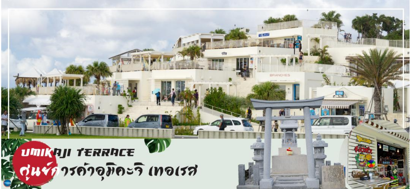
UMIKAJI TERRACE ศูนย์การค้าอุมิคะจิ เทอเรส

ใช้เวลาอันสมควรนำท่านเดินทางสู่โรงแรมที่พัก (ใช้เวลาเดินทางประมาณ 30 นาที) ที่พัก HOTEL ART STAY NAHA KOKUSAI-DORI หรือเทียบเท่า