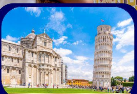
หอเอนแห่งเมืองปิซา

Special OFFER ฟรี !! ล่องเรือ Gondola เกาะเวนิส เมืองแห่งสายน้ำสุดโรแมนติก