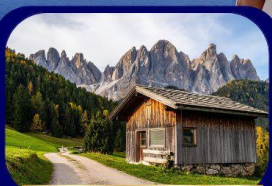
อุทยานฯ โดโลไมท์