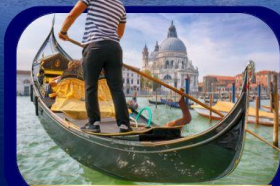
เที่ยวเกาะเวนิส