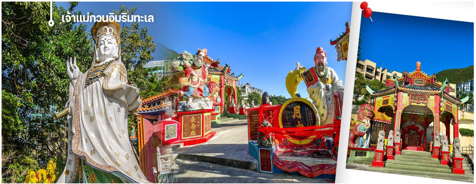
เจ้าแม่กวนอิมบริษะเล

รัก ไหว้ขอเนือคู่, ศาลา 8 เหลี่ยม เชื่อกันว่าเป็นจุดที่มีอวงจ้ยดีที่สุดในศาลาแปดเหลี่ยม จุดกึ่งกลางของพื้นจะมีรูปแปดเหลี่ยม ให้เราไปยื่นขอพรจากตำแหน่งนี้เพื่อขอพลังจากสวรรค์ และอีกมากมาย