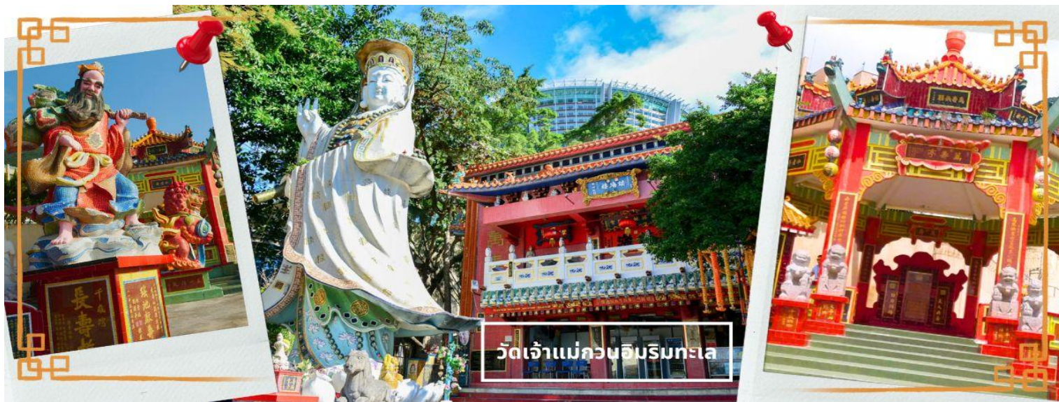
วัดเจ้าแม่กวนอิมรับทะเล

ที่สุดของฮ่องกง บริเวณวัดจะมี เจ้าแม่กวนอิมองค์ใหญ่ ปางประทานพรตั้งอยู่ เป็นเทพที่ชาวฮ่องกงและคนจีนให้ความเคารพนับถือมากที่สุด สามารถขอพรได้ทุกเรื่อง วัดนี้เป็นที่นิยมมีนักท่องเที่ยวเดินทางมาขอพรกันมากมาย เพราะเชื่อในความศักดิ์สิทธิ์ และยังมีเจ้าแม่ทับทิม หรือเทพธิดาแห่งท้องทะเลองค์ใหญ่ ซึ่งคนฮ่องกง คนมาเก๊า และคนจีน ที่อยู่ริมทะเล ชาวประมง นักเดินเรือหรือผู้ที่เดินทางทางเรือเป็นประจำ จะนับถือเจ้าแม่ทับทิมเป็นอย่างมาก มีความเชื่อว่าเจ้าแม่ทับทิมจะปกป้องเราจากภัยอันตรายระหว่างการเดินทาง ภายในวัดยังมีเทพเจ้าและพระพุทธรูปต่างๆ ประดิษฐานไว้มากมายตามความเชื่อถือศรัทธา เช่น เทพเจ้าไฉ่ซิงเอี้ย ไหว้ขอโชคลาภความมั่งคั่ง ความร่ำรวย, พระสังกัจจายน์ โพธิสัตว์ เทพประทาน บุตร-ธิดา ไหว้อธิษฐานขอลูก, สะพานต่ออายุ (สะพานอายุยืน) สะพานสีแดงตั้งอยู่บนริมหาด สีแดงสด เชื่อกันว่า คนจีนเชื่อกันว่าหากเดินข้ามสะพานนี้ เราจะมีอายุยืนขึ้นอีก 3 วัน (3 วัน บนสวรรค์ = 3 ปี บนโลกมนุษย์) นั้นหมายความว่า ถ้าเราเดินข้ามสะพานนี้แล้ว จะมีอายุยืนยาวขึ้นอีก 3 ปี บนโลกมนุษย์, เทพเจ้าแห่งความรัก ไหว้ขอเนื้อคู่, ศาลา 8 เหลี่ยม เชื่อกันว่าเป็นจุดที่มีดวงจ้ายดีที่สุด ภายในศาลาแปดเหลี่ยม จุดกึ่งกลางของพื้นจะมีรูป