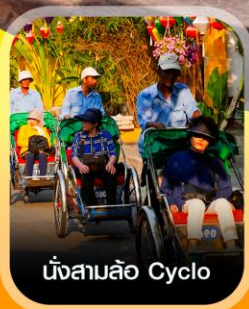
นั่งสามล้อ Cyclo

✈️ คอนเฟิร์มออกเดินทาง ทุกพีเรียด 2 ท่านขึ้นไป