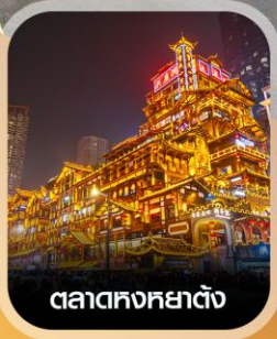
ตลาดหงหยาดัง