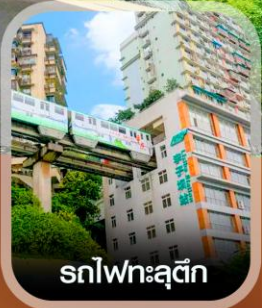
รถไฟฟ้าลูติก

✈️ คอนเฟิร์ม ออกเดินทาง ทุกพีเรียด 2 ท่านขึ้นไป