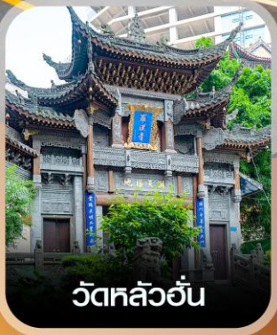
วัดหลิวอัน