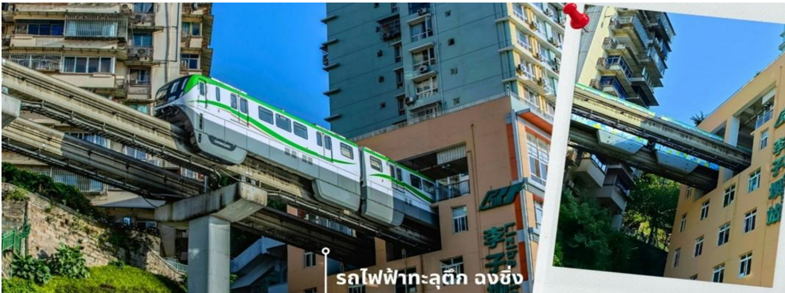
รถไฟฟ้าทะลุตึก ลงชิง

จากนั้นนำท่านนั่งรถไฟฟ้าทะลุตึก หรือ สถานี Liziba เป็นสถานีรถไฟแบบขานขาลา สิ่งที่ทำให้สถานี Liziba มีชื่อเสียงไปทั่วโลกคือ “เส้นทางรถไฟที่วิ่งทะลุผ่านอาคารสูง 19 ชั้น” โดยมีระบบลดเสียงและแรงสั่นสะเทือน ทำให้ผู้ที่อาศัยอยู่ในตึกไม่ได้รับผลกระทบจากเสียงดังมาก กลายเป็นภาพอันน่าตื่นตาตื่นใจของผู้ที่มาเยือนทั้งนักท่องเที่ยวที่เดินทางมาเป็นครั้งแรก ผู้โดยสารบนขบวนรถไฟและผู้เข้าชมจากจุดชมวิวที่ต่างตื่นตันทึ่งไปตามๆกันกับการที่ได้เห็นรถไฟวิ่งทะลุตึกนี้ สถานี Liziba ได้รับการยกย่องให้เป็น 1 ในสถานที่สำคัญที่สะท้อนความเติบโตของจีนตลอด 70 ปี ซึ่งไม่ได้เกิดขึ้นโดยบังเอิญ รถไฟฟ้าทะลุตึกนี้คือตัวอย่างของความอัจฉริยะในการออกแบบการคมนาคมในเมืองภูเขาแห่งนี้ให้ท่านได้สัมผัสประสบการณ์กับการขึ้นนั่งบนรถไฟเพื่อผ่านทะลุตึกและเก็บภาพบรรยากาศ