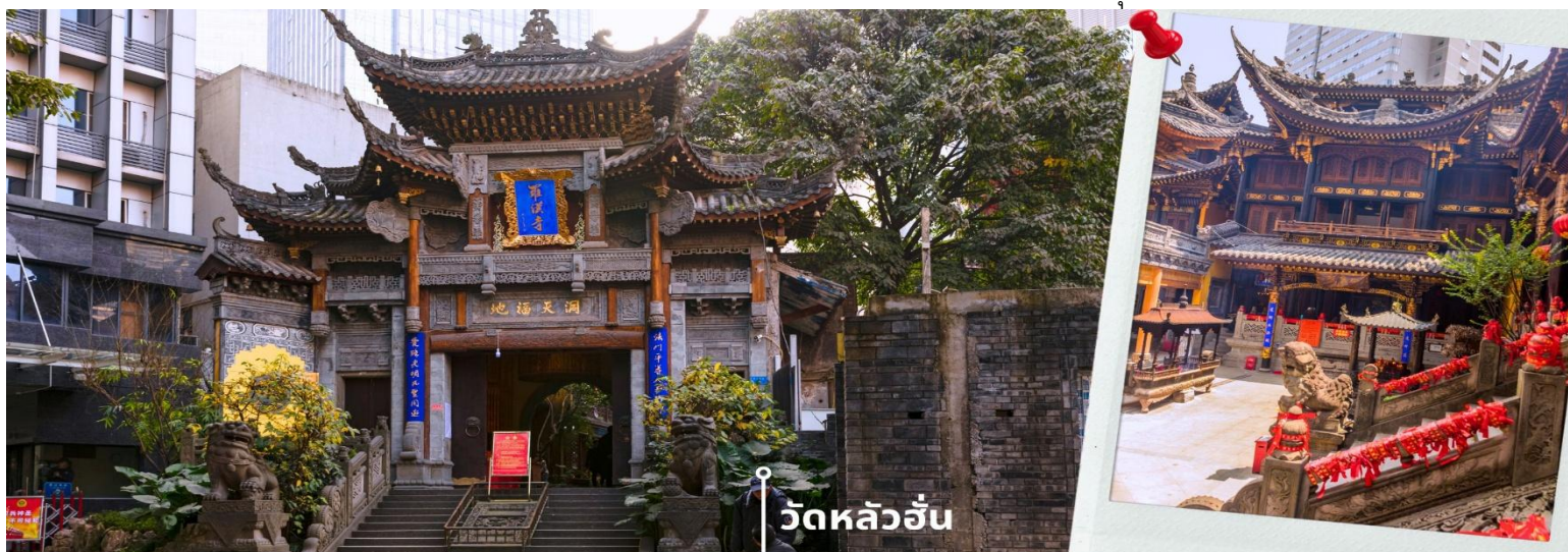
วัดหลัวอัน

นำท่านเดินทางสู่ วัดหลัวอัน (Luohan Temple) วัดสำนักงานใหญ่พุทธสมาคมแห่งนครฉงชิ่ง เป็นวัดเก่าแก่ที่สุดในฉงชิ่ง (Chongqing) ซึ่งสร้างขึ้นเมื่อ 1,000 ปีก่อน มีประวัติความเป็นมายาวนานเป็นจุดหมายทางศาสนาและเป็นศูนย์กลางของชาวพุทธในภูมิภาคการท่องเที่ยวที่สำคัญของภูมิภาค และเป็นแหล่งเรียนรู้ที่สำคัญของศิลปวัฒนธรรมจีน วัดนี้ประดิษฐานพระอรหันต์ถึง 500 องค์ แต่ละองค์มีลักษณะ ท่าทาง และสีหน้าแตกต่างกัน มีสถาปัตยกรรมแบบจีนโบราณที่สวยงามและละเอียดอ่อน พระอรหันต์ 500 องค์ แกะสลักด้วยหินและไม้ สะท้อนถึงความเชื่อในพุทธศาสนาและมีมือศิลปะจีน