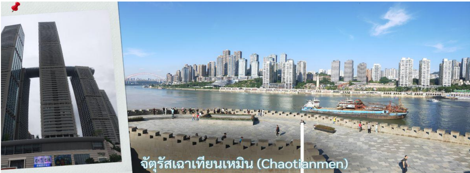
จัตุรัสเฉาเทียนเหมิน (Chaotianmen)

จากนั้น นำท่านเดินทางสู่ จัตุรัสเฉาเทียนเหมิน ซึ่งตั้งอยู่ ณ จุดบรรจบของ แม่น้ำแยงซี และ แม่น้ำเจียหลิง นับเป็นท่าเรือขนส่งทางน้ำที่ใหญ่ที่สุดของนครฉงชิ่ง และเป็นศูนย์กลางการค้าสำคัญมาอย่างยาวนาน บริเวณนี้ยังเป็นที่ตั้งของ ตลาดการค้าครบวงจรเฉาเทียนเหมิน ซึ่งถือเป็นตลาดขนาดใหญ่ที่สุดของฉงชิ่ง ทำให้พื้นที่โดยรอบเต็มไปด้วยผู้คนและมีชีวิตชีวาอยู่เสมอ ตั้งแต่อดีตจนถึงปัจจุบัน จัตุรัสแห่งนี้ได้รับการออกแบบให้มีลักษณะคล้ายเรือยักษ์ที่กำลังแล่นออกสู่สายน้ำอย่างสง่างาม จึงได้รับสมญานามว่า “ไททานิคแห่งฉงชิ่ง” เมื่อยืนอยู่บนจัตุรัส ท่านจะสามารถมองเห็นภาพอันน่าประทับใจของจุดบรรจบระหว่างแม่น้ำสองสาย โดยน้ำสีเหลืองของแม่น้ำแยงซีและน้ำสีเขียวมรกตของแม่น้ำเจียหลิงไหลมาบรรจบกันอย่างชัดเจน สร้างทัศนียภาพที่สวยงามและเป็นเอกลักษณ์ของฉงชิ่งอย่างแท้จริง