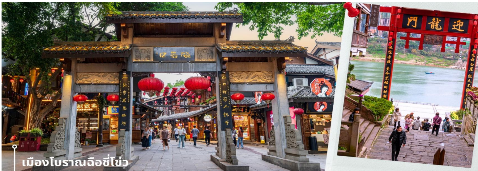
เมืองโบราณลือชี่ไซ่

เที่ยวฉงชิ่ง ที่เหมาะแก่การมาเดินเที่ยว ชิมอาหาร ถ่ายรูป และสัมผัสวิถีชีวิตแบบดั้งเดิมของชาวฉงชิ่งอย่างใกล้ชิดในบรรยากาศที่แสนสบาย