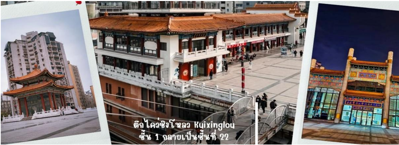
ตึก ไคว่จิงโหลว Kujinglou ชั้น 1 กลายเป็นชั้นที่ 22

จากนั้น นำท่านเดินทางสู่ จัตุรัสเฉาเทียนเหมิน ซึ่งตั้งอยู่ ณ จุดบรรจบของ แม่น้ำแยงซี และ แม่น้ำเจียหลิง นับเป็นท่าเรือขนส่งทางน้ำที่ใหญ่ที่สุดของนครฉงชิ่ง และเป็นศูนย์กลางการค้าสำคัญมาอย่างยาวนาน บริเวณนี้ยังเป็นที่ตั้งของ ตลาดการค้าครบวงจรเฉาเทียนเหมิน ซึ่งถือเป็นตลาดขนาดใหญ่ที่สุดของฉงชิ่ง ทำให้พื้นที่โดยรอบเต็มไปด้วยผู้คนและมีชีวิตชีวาอยู่เสมอ ตั้งแต่อดีตจนถึงปัจจุบัน จัตุรัสแห่งนี้ได้รับการออกแบบให้มีลักษณะคล้ายเรือยักษ์ที่กำลังแล่นออกสู่สายน้ำอย่างสง่างาม จึงได้รับสมญานามว่า “ไททานิคแห่งฉงชิ่ง” เมื่อยืนอยู่บนจัตุรัส ท่านจะสามารถมองเห็นภาพอันน่าประทับใจของจุดบรรจบระหว่างแม่น้ำสองสาย โดยน้ำสีเหลืองของแม่น้ำแยงซีและน้ำสีเขียวมรกตของแม่น้ำเจียหลิงไหลมาบรรจบกันอย่างชัดเจน สร้างทัศนียภาพที่สวยงามและเป็นเอกลักษณ์ของฉงชิ่งอย่างแท้จริง