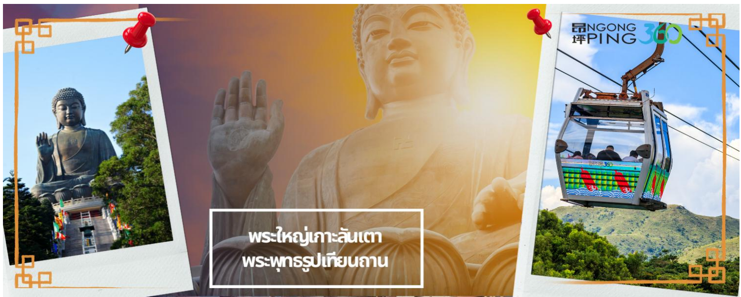
พระใหญ่เกาะลันเตา พระพุทธรูปเทียนถาน

จากนั้นเดินทางสู่เกาะลันเตา เพื่อไปที่สถานีตุงซุง ท่านจะได้สัมผัสกับประสบการณ์ที่น่าตื่นตาตื่นใจจาก กระเช้าลอยฟ้ามองปิ๊ง (NGONG PING SKYRAIL 360 **รวมบัตร STANDARD CABIN**) ซึ่งถือได้ว่าเป็นแหล่งท่องเที่ยวอันมีเอกลักษณ์ระดับโลกของฮ่องกง ที่มีระยะทางกว่า 5.7 กิโลเมตร ใช้เวลาประมาณ 25 นาที ท่านจะได้สัมผัสบรรยากาศจากบนกระเช้ามุมสูง เส้นทางกระเช้าเชื่อมจากใจกลางเมืองตุงซุง ถึง หมู่บ้านวัฒนธรรมมองปิ๊ง บนเกาะลันเตา ท่านจะได้ชมวิวแบบพาโนรามา 360 องศา ของสนามบินนานาชาติฮ่องกง ทิวทัศน์เหนือท้องทะเลของทะเลจีนใต้ ชมวิวของเนินเขาอันเขียวขจี น้ำตก ลำธาร และป่าอันเขียวชอุ่มของอุทยานบนเกาะลันเตาเหนือ (**กรณีกระเช้ามองปิ๊ง 360 มีการปิดซ่อมบำรุง หรือ มีการปิดเนื่องจากสภาพอากาศแปรปรวน ทางบริษัทฯ ขอสงวนสิทธิ์ในการเปลี่ยนเป็นใช้รถโค้ชของทางอุทยานในการเดินทาง เพื่อนำท่านขึ้นสู่หมู่บ้านวัฒนธรรมมองปิ๊ง บนเกาะลันเตาแทน**)