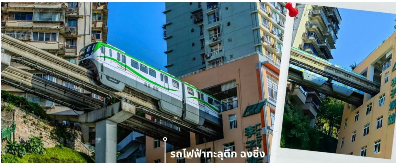
รถไฟฟ้าทะเลตุ๊ก ฉงชิ่ง

จากนั้นนำท่านเดินทางไปชม รถไฟฟ้าทะเลตุ๊ก หรือ สถานี Liziba เป็นสถานีรถไฟฟ้าแบบชานชาลา สิ่งที่ทำให้สถานี Liziba มีชื่อเสียงไปทั่วโลกคือ “เส้นทางรถไฟที่วิ่งทะลุผ่านอาคารสูง 19 ชั้น” โดยมีระบบลดเสียงและแรงสั่นสะเทือน ทำให้ผู้ที่อาศัยอยู่ในตึกไม่ได้รับผลกระทบจากเสียงดังมาก กลายเป็นภาพอันน่าตื่นตาตื่นใจของผู้ที่มาเยือนทั้งนักท่องเที่ยวที่เดินทางมาเป็นครั้งแรก ผู้โดยสารบนขบวนรถไฟและผู้เข้าชมจากจุดชมวิวก็นั่งตักบันไดขึ้นตามบันไดที่ติดกับอาคารที่เห็นรถไฟวิ่งทะลุตึกนี้ สถานี Liziba ได้รับการยกย่องให้เป็น 1 ในสถานที่สำคัญที่สะท้อนความเติบโตของจีนตลอด 70 ปี ซึ่งไม่ได้เกิดขึ้นโดยบังเอิญ รถไฟฟ้าทะเลตุ๊กนี้คือตัวอย่างของความอัจฉริยะในการออกแบบการคมนาคมในเมืองภูเขาแห่งนี้ ให้สามารถพัฒนาไปข้างหน้าได้อีกในอนาคต ให้ท่านได้สัมผัสประสบการณ์กับการขึ้นนั่งบนรถไฟเพื่อผ่านทะเลตุ๊กและเก็บภาพบรรยากาศ