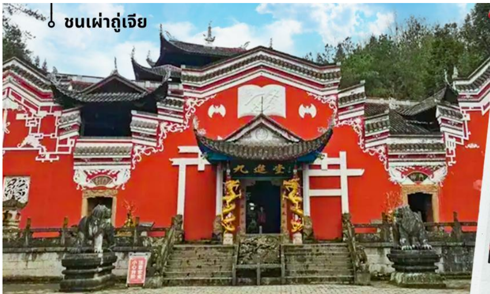
๐ ชนเผ่าภูเขา

ของการท่องเที่ยวเมืองนี้ เพราะนักท่องเที่ยวจะได้ทั้งชมภูมิทัศน์ที่สวยงาม และเรียนรู้วัฒนธรรมชาติพันธุ์ที่ยังคงรักษา ขนบประเพณีดั้งเดิมไว้อย่างชัดเจน