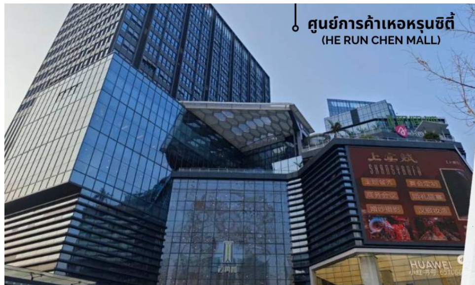
๐ ศูนย์การค้าเหอหฺรฺนชิตี้ (HE RUN CHEN MALL)

ให้ท่านอิสระช้อปปิ้ง ศูนย์การค้าเหอหฺรฺนชิตี้ HE RUN CHEN MALL ตั้งอยู่ที่สี่แยกถนนชื่อโจวและถนนตงเฟิง ในเมือง เอนซือ มณฑลหูเป่ย์ มีพื้นที่ก่อสร้างประมาณ 120,000 ตารางเมตร และมูลค่าการลงทุนรวมประมาณ 2.6 พันล้านบาท ก่อสร้างโดยบริษัทเอนซือเหอหฺรฺน คอนสตรัคชั่น อินเวสต์เมนต์ กรุ๊ป และบริหารงานโดยบริษัทเอนซือเหอหฺรฺน ชิตี้ คอมเมอร์ เชียล แมเนจเม้นท์ ในฐานะศูนย์การค้าหลักของเมือง ศูนย์การค้าแห่งนี้รวบรวมแบรนด์ดังทั้งในประเทศและต่างประเทศกว่า 300 แบรนด์ รวมถึงแบรนด์น้องใหม่กว่า 50 แบรนด์ในเอนซือ เช่น สตาร์บัคส์ แมคโดนัลด์ และกาแล็กซี่ ซินี่มา ทางเดินเลียบ แม่น้ำยาว 500 เมตร เต็มไปด้วยต้นแปะก๊วยในฤดูใบไม้ร่วงและดอกซากุระสีชมพูในฤดูใบไม้ผลิ บนถนนยี่สุ่ยมีตลาดกลางคืน ริมแม่น้ำที่คึกคักเปิดให้บริการตลอดวัน ศูนย์การค้าแห่งนี้ผสมผสาน 5 จุดเด่น ได้แก่ การใช้ชีวิตริมน้ำ ความหลากหลาย แฟชั่น สิ่งอำนวยความสะดวกสำหรับครอบครัว และความบันเทิงทันสมัย