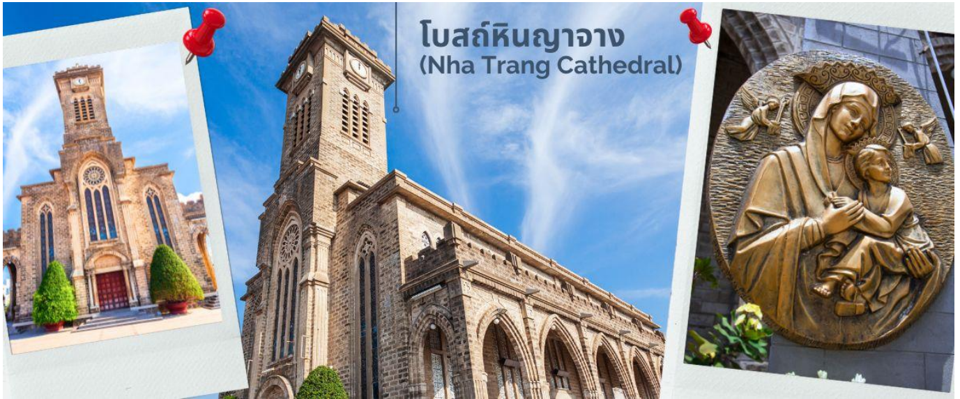
โบสถ์หินญากาง (Nha Trang Cathedral)

พาท่านชม โบสถ์หินญากาง (Nha Trang Cathedral) เป็นโบสถ์ที่ใหญ่ที่สุดในเมืองญากาง ตั้งโดดเด่นอยู่ บนเนินสูง 10 เมตร ห่างจากทะเลเพียงแค่ 1 กิโลเมตร โบสถ์หลังนี้ถูกสร้างขึ้นในสไตล์ฝรั่งเศสโกธิก ภายในโบสถ์ถูกตกแต่งด้วยกระจกสีที่มีสีสันสวยงาม พื้นที่ภายในโบสถ์จะมี 760 ตร.กม. สามารถบรรจุคนได้ถึง 600 คน ตัวโบสถ์ถูกสร้างด้วยบล็อกซีเมนต์ และใช้หินในการปูพื้น