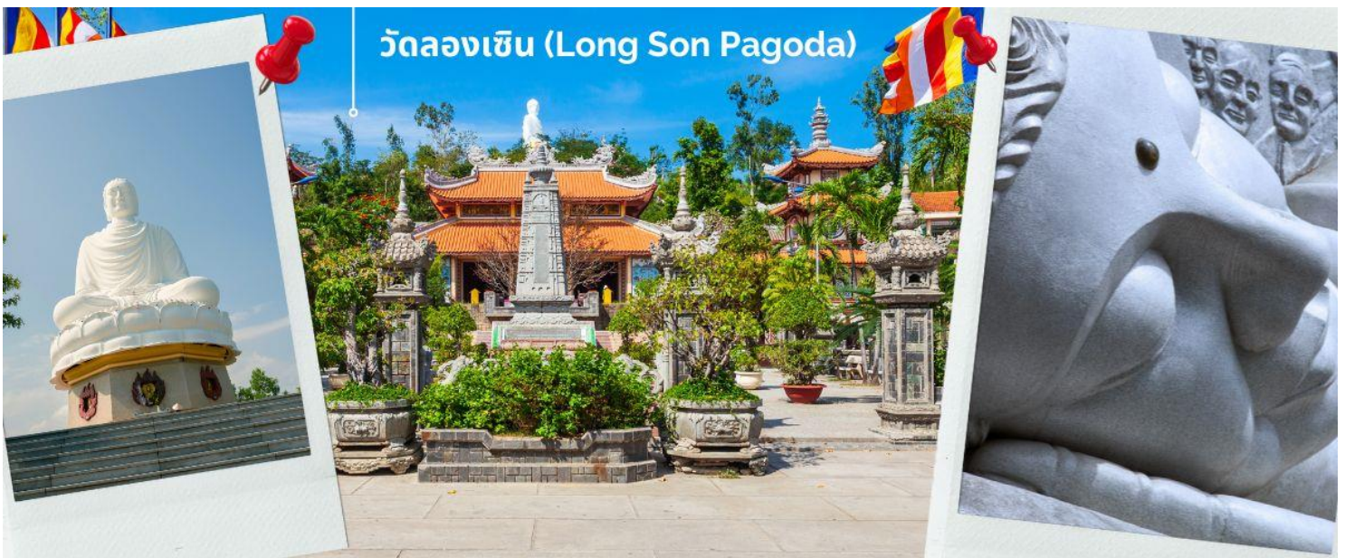
วัดลองเซิน (Long Son Pagoda)

นำท่านไหว้พระขอพรที่ วัดลองเซิน (Long Son Pagoda) วัดจีนเก่าแต่ตั้งอยู่บนเนินเขามังกร เป็นวัดพุทธมหายานเก่าแก่และใหญ่ที่สุดของเมืองญาจาง ประเทศเวียดนาม ที่วัดนี้มีจุดเด่นคือพระพุทธรูปองค์ใหญ่สีขาว สูงราว 14 เมตร การเที่ยวชมวัดลองเซินต้องเดินขึ้นบันได 152 ชั้น เพื่อไปนมัสการพระพุทธรูปองค์ใหญ่นายอดเขาที่ประทับบนฐานดอกบัววัดนี้เป็นอีกหนึ่งไฮไลท์ที่ต้องแวะมาชมให้ได้ เพราะความสวยงามอลังการของตัววัดและวิวที่สามารถมองเห็นทั่วเมืองญาจางได้จากยอดเขา