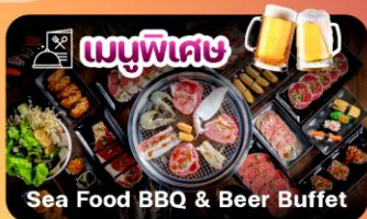
Sea Food BBQ & Beer Buffet

รถราง Datanla New Alpine Coaster-ชายหาดญาจาง-พระใหญ่วัดลองเซิน-เที่ยว 2 ไนต์มาร์เก็ตตั่ง