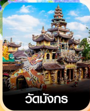
วัดมังกร