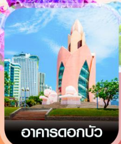
อาคารดอกบัว

คอนเฟิร์มออกเดินทาง ทุกพีเรียด 2 ท่านขึ้นไป