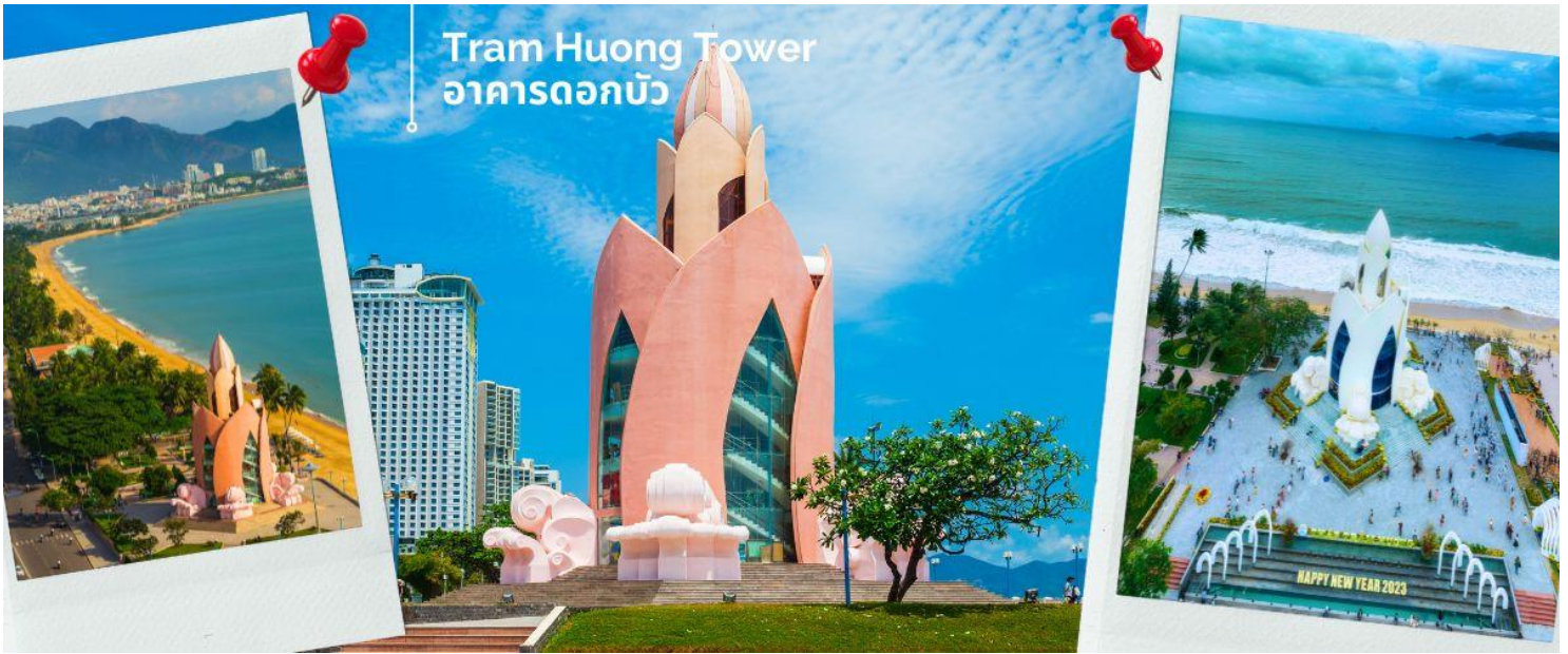
Tram Huong Tower อาคารดอกบัว