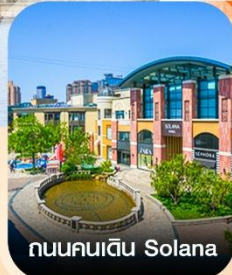
ถนนคนเดิน Solana