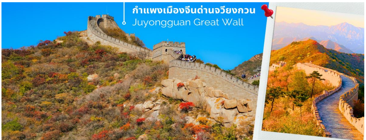
กำแพงเมืองจีนด่านจวิยงกวน Juyongguan Great Wall

จากนั้นนำท่านเดินทางชมความยิ่งใหญ่ของ กำแพงเมืองจีนด่านจวิยงกวน (Juyongguan Great Wall) หรือที่รู้จักกันในชื่อ ป้อมฉวิหยง เป็นด่านที่ใกล้กับใจกลางกรุงปักกิ่งมากที่สุด ราว 50 กิโลเมตร เท่านั้น นับเป็นหนึ่งในด่านสำคัญและเป็นสัญลักษณ์ของกำแพงเมืองจีน มีความยาวราว 4 กิโลเมตร ตั้งอยู่ทางทิศตะวันตกเฉียงเหนือของกรุงปักกิ่ง สร้างขึ้นในสมัย จิ้นซีฮ่องเต้ กำแพงนี้ตั้งอยู่ในหุบเขา Guanguo ทำให้มีข้อได้เปรียบโดยธรรมชาติคือสามารถ "ยึดครองได้ง่าย แต่โจมตีได้ยาก" ถือเป็นหนึ่งจุดเริ่มต้นของกำแพงเมืองจีนในภาคเหนือ ซึ่งสร้างขึ้นเพื่อป้องกันกรุงปักกิ่งการรุกรานจากชนเผ่าเร่ร่อน ด่านฉวิหยงกวนมีสถาปัตยกรรมที่สวยงามของศิลปะจีน จากยอดด่านสามารถมองเห็นทิวทัศน์ที่สวยงามของเทือกเขาและธรรมชาติโดยรอบ นับว่าเป็น 1 ใน 8 จุดชมวิวที่มีชื่อเสียงของปักกิ่งมาตั้งแต่สมัยราชวงศ์จิ้น ได้เวลาอันสมควร กลับปักกิ่ง แวะร้านยาสมุนไพรบัวหิมะ