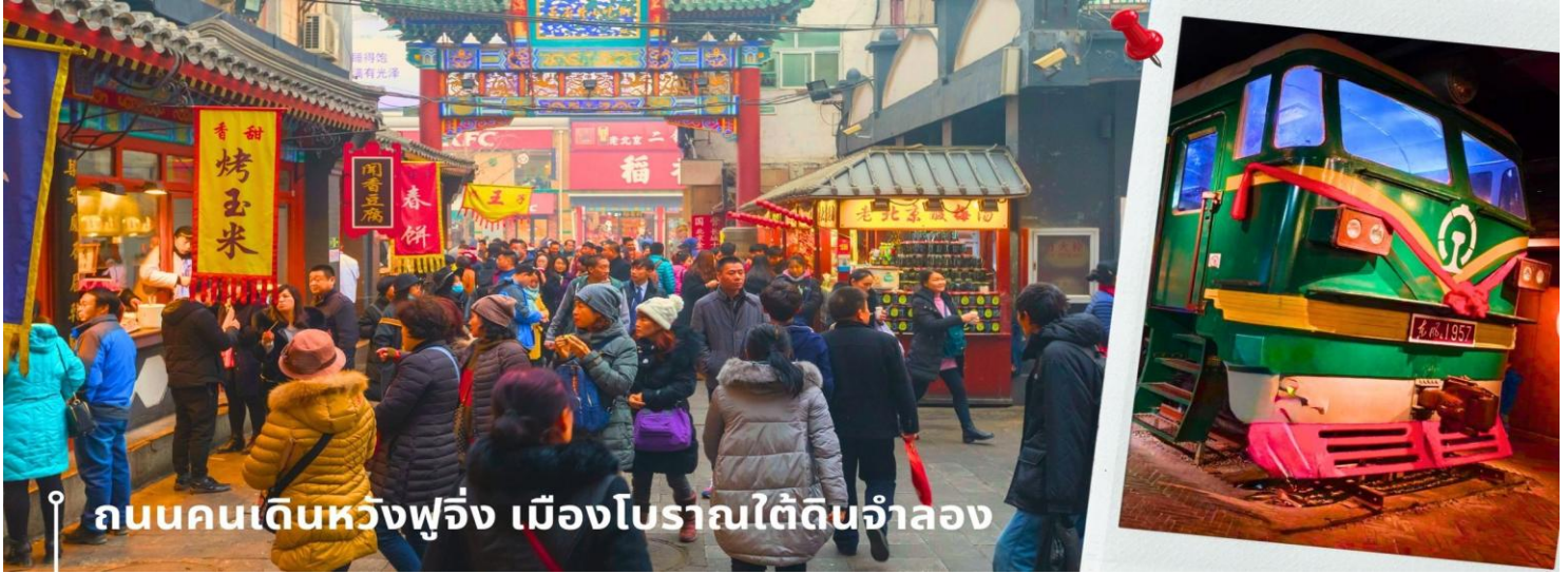
ถนนคนเดินหวังฟูจิ่ง เมืองโบราณใต้ดินจำลอง