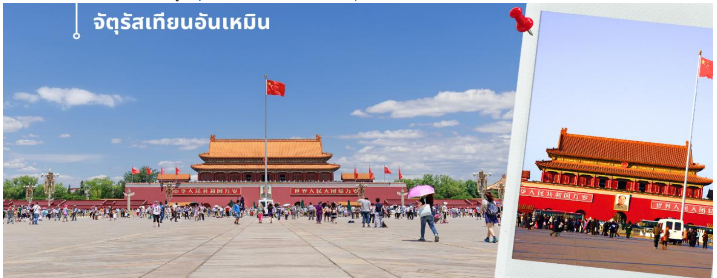
จัดรัฐเทียนอันเหมิน

นำท่านเดินทางสู่ จัดรัฐเทียนอันเหมิน ในใจกลางกรุงปักกิ่ง สัญลักษณ์อันทรงพลังของประเทศจีน ก่อสร้างเมื่อปี ค.ศ.