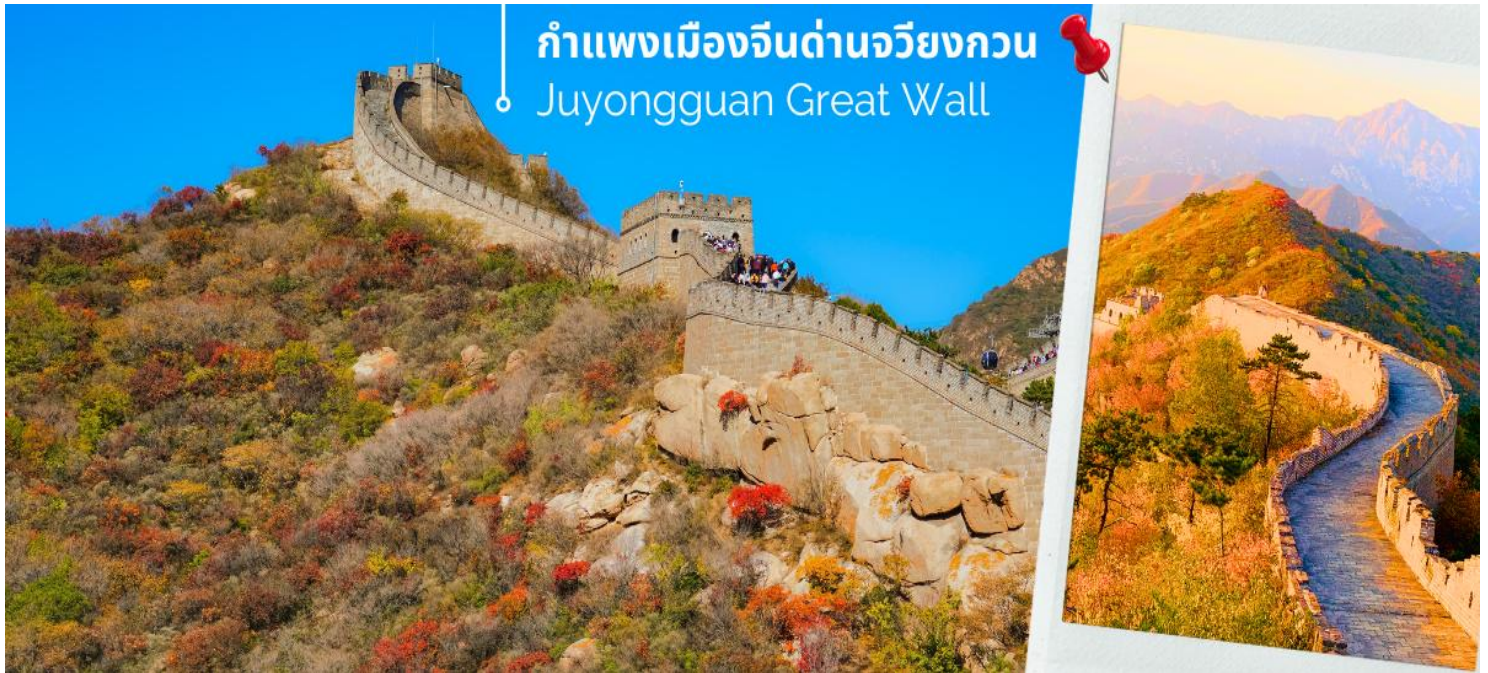
กำแพงเมืองจีนด่านจวิยงกวน Juyongguan Great Wall

จากนั้นนำท่านเดินทางชมความยิ่งใหญ่ของ กำแพงเมืองจีนด่านจวิยงกวน (Juyongguan Great Wall) หรือที่รู้จักกันในชื่อ ป้อมจวิยง เป็นด่านที่ใกล้กับใจกลางกรุงปักกิ่งมากที่สุด ราว 50 กิโลเมตร เท่านั้น นับเป็นหนึ่งในด่าน