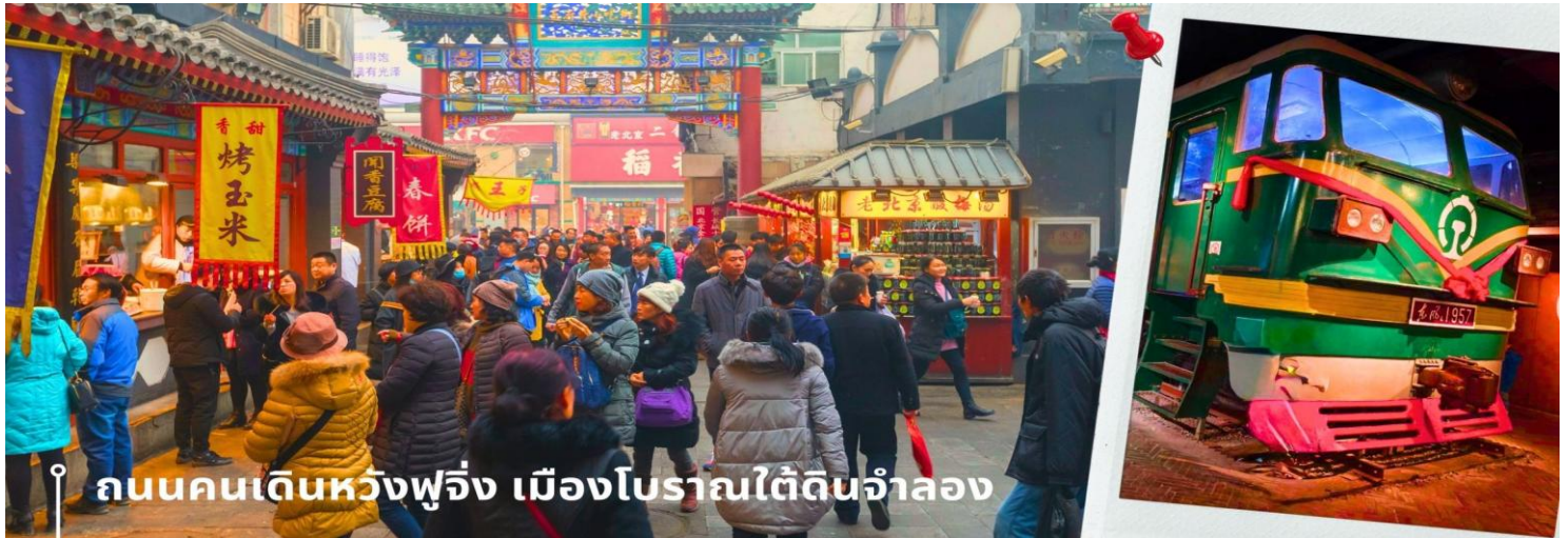
ถนนคนเดินหวังฟูจิ่ง เมืองโบราณใต้ดินจำลอง

ใช้พื้นที่ส่วนหนึ่งเปิดเป็นร้านขายงานฝีมือ เครื่องเขียนจีน เช่น พู่กัน แผ่นหมึก เครื่องประดับหยก ไข่มุก ภาพลายมือ ของบุคคลมีชื่อเสียง ยาจีน และงานหัตถกรรมต่างๆ ทั้งยังให้บริการปรึกษาแพทย์แผนจีน อีกด้วย