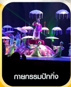
กายกรรมปักกิ่ง