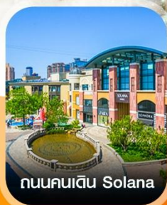
ถนนคนเดิน Solana

✈️ คอนเฟิร์มออกเดินทาง ทุกพีเรียด 2 ท่านขึ้นไป