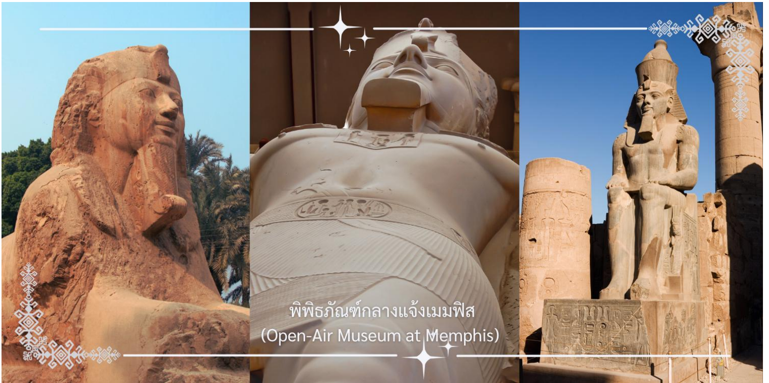
พิพิธภัณฑ์กลางแจ้งเมมฟิส (Open-Air Museum at Memphis)

นำท่านเดินทางสู่ ซัคคารา (Saqqara) หนึ่งในสุสานหลวงที่สำคัญที่สุดของอียิปต์โบราณ ตั้งอยู่ทางใต้ของกรุงไคโร เป็นส่วนหนึ่งของเนโครโพลิสแห่งเมมฟิส ที่นี่ถือเป็นต้นแบบของการสร้างพีระมิดในยุคแรกเริ่ม และยังเป็นที่ตั้งของ พีระมิดขั้นบันได (Step Pyramid) อันเลื่องชื่อของฟาโรห์โจเซอร์ (Djoser)