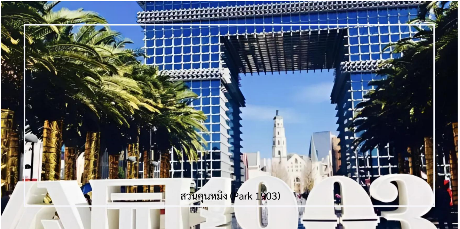
สวนคูนหมิง (Park 1903)

จากนั้นนำท่าน ชมสวนคูนหมิง (Park 1903) เป็นสวนสาธารณะ เหมาะสำหรับการพักผ่อนและเพลิดเพลินกับธรรมชาติ สวนแห่งนี้มีพื้นที่กว้างขวาง มีเส้นทางเดินเล่น สนามหญ้า และพื้นที่สำหรับกิจกรรมต่างๆ นอกจากนี้ยังมีต้นไม้และดอกไม้ที่หลากหลาย ทำให้สวนมีบรรยากาศสดชื่นและสงบเงียบ