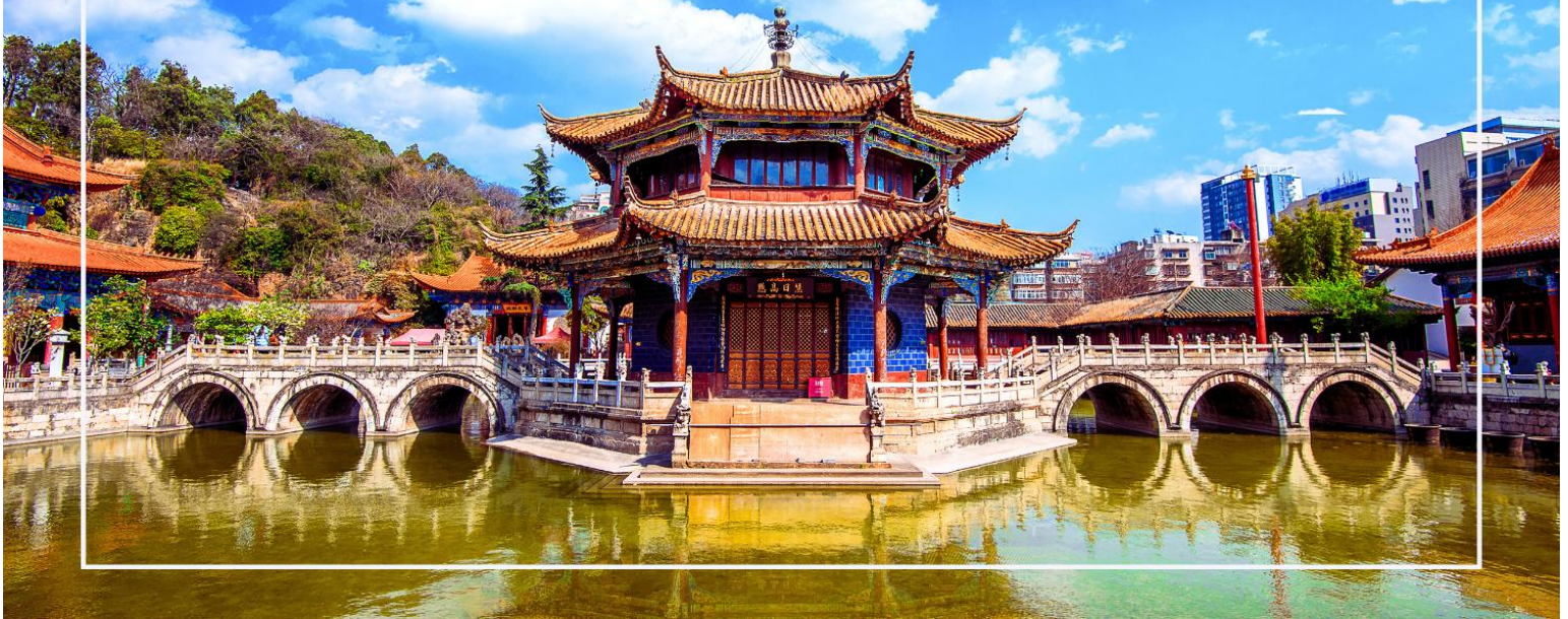
วัดหยวนทง (Yuantong Temple)

ผู้คนจำนวนมากเดินทางมาขอพร โดยความเชื่อที่ได้รับความนิยม ได้แก่ การขอให้มียศพร ขอเนื้อคู่ หรือขอพรด้านสุขภาพ เพื่อให้สมปรารถนาและเป็นสิริมงคลแก่ชีวิต