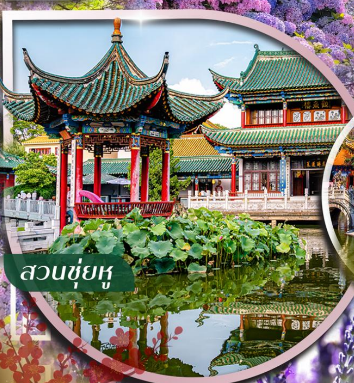
สวนชู่ฮู